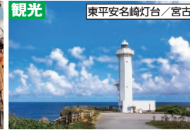
観光 東平安名崎灯台/宮古