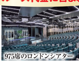
975席のロンドンシアター