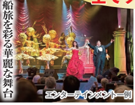
エンターテインメントショー