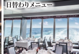
日替わりメニュー ライトハウスレストラン