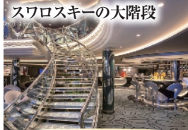
スワロスキーの大階段