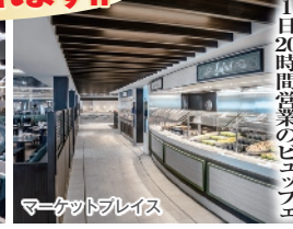
マーケットプレイス