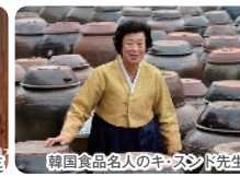
韓国食品名人のキ・スンド先生