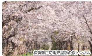
松前藩戸切地陣屋跡の桜トンネル