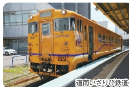
道南いさりび鉄道