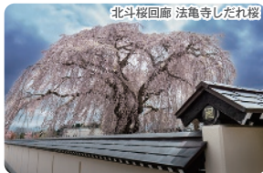
北斗桜回廊 法亀寺しだれ桜

北斗市には、桜の名所が数多くあり、その代表として、法亀寺のしだれ桜、松前藩戸切地陣屋跡の桜トンネル、大野川沿いの桜並木を見学致します。