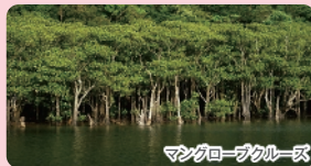
マングローブクルーズ