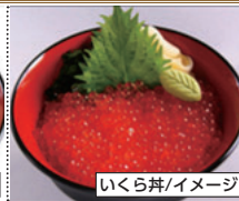
いくら丼/イメージ