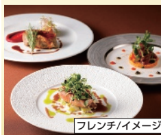
フレンチ/イメージ