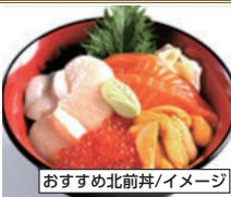
おすすめ北前丼/イメージ