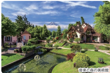
音楽と森の美術館