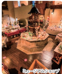
ミュージアムショップ