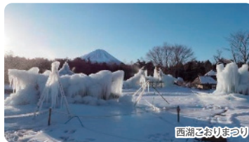
西湖こおりまつり

毎年2月上旬～中旬に野鳥の森公園で開かれる氷の芸術祭です。高さ5メートルにもなる樹氷は迫力満点。夜間はライトアップされ、幻想的な景色が楽しめます。