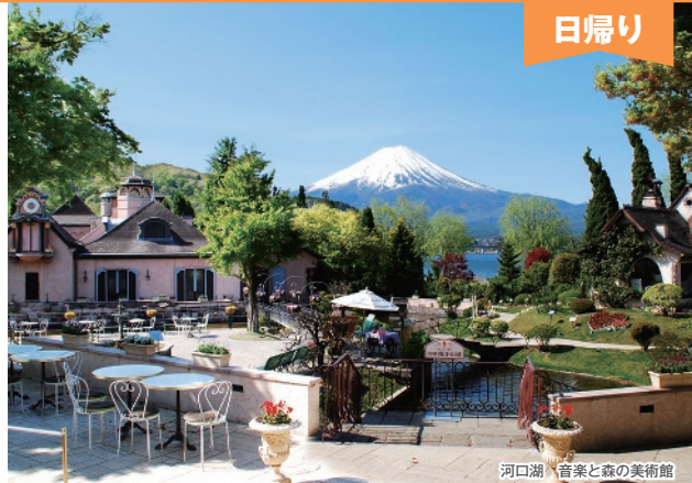
河口湖 音楽と森の美術館