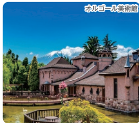
オルゴール美術館