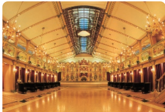
オルガンホール／世界最大規模のダンスオルガン

富士山と共に河口湖畔に佇むエンターテインメント美術館。ヨーロッパ調の建物が並ぶ園内には季節の花々が咲き誇り、晴れた日には絶景の富士山を望むことができます。動く砂の紙芝居「サンドアートコンサート」と「自動演奏楽器とオペラ歌手のコラボコンサート」は連日開催。色々なイベントコンサートがございますので、スケジュール調整しながら、ご鑑賞ください。