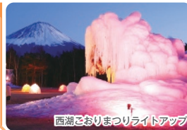
西湖こおりまつりライトアップ