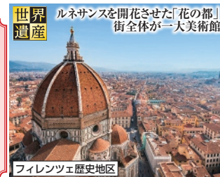
フィレンツェ歴史地区