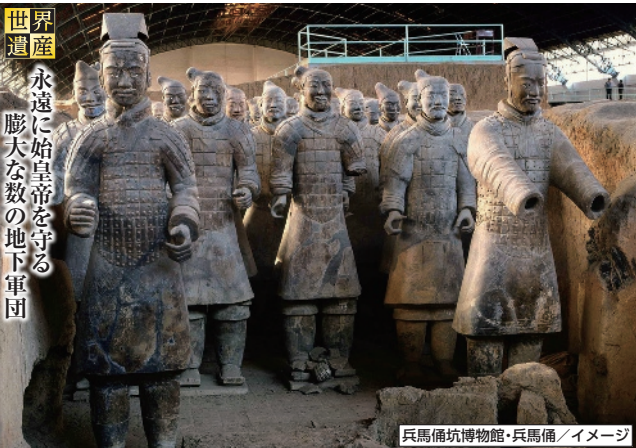
兵馬俑坑博物館・兵馬俑／イメージ