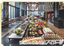
ディナーbuffet/イベージ

※3歳未満のお子様は入場不可 となっております。 ※ご移動にかかる交通費は お客様負担となります。