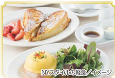
NYスタイルの軽食/イベージ

※3歳未満のお子様は入場不可 ※スペシャルプランの内容は弊社 WEBサイトをご確認ください。 ※ご移動にかかる交通費は お客様負担となります。