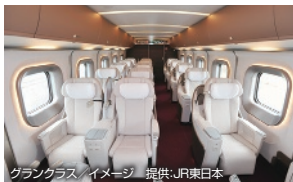
グランクラス / イメージ