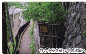
竹の小径を歩いて古稀庵へ