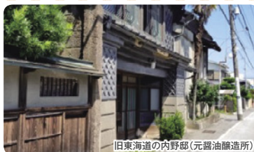
旧東海道の内野邸(元醤油醸造所)

古い町並みが点在する旧東海道では、元醤油醸造の内野邸、老舗の豆腐屋や旧朝倉邸をリノベーションした喫茶店など見どころがいっぱいです。箱根寄木細工を芸術にまで高めた太田木工のアトリエ兼ショップは元小田原大窪村役場庁舎です。地域で活躍する小田原っ子がガイドを務めます。