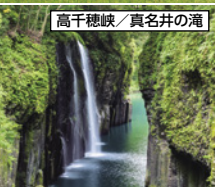
高千穂峡／真名井の滝