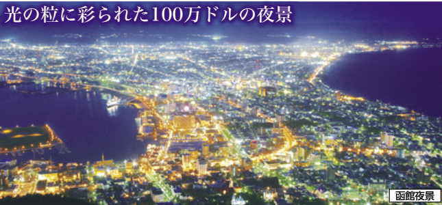
光の粒に彩られた100万ドルの夜景