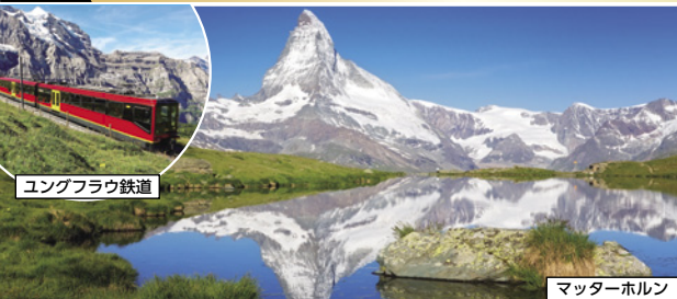
ユングフラウ鉄道

スイス2大名峰とドイツ・フランス・リヒテンシュタイン マッターホルンの麓 ツェルマットに2連泊 8日間