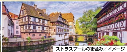
ストラスブールの街並み/イメージ