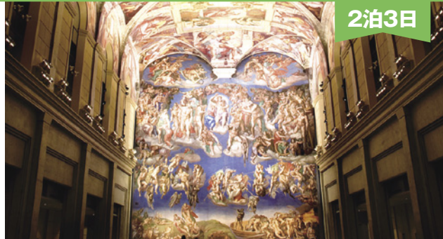
大塚国際美術館・システーナ礼拝堂(写真は倉敷国際美術館の展示作品を撮影したものです)