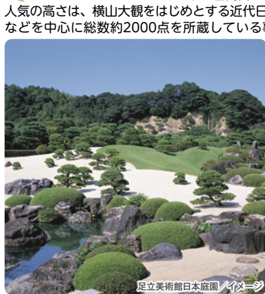
足立美術館日本庭園/イナズミ

島根県安来市の郊外に、美しい庭園を持つ美術館があります。国内外から年間50万人以上が訪れる