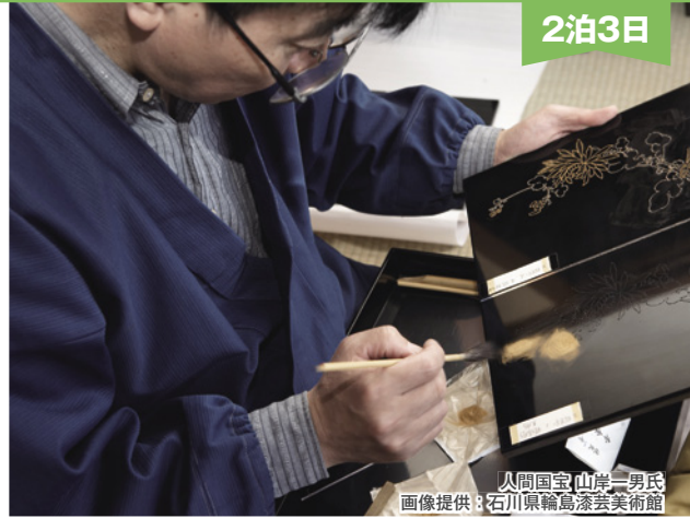
人間国宝(山崎一男氏)