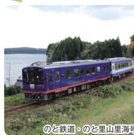
のと鉄道・のと里山里海号

能登半島の東側、穴水駅～七尾駅(今回は和倉温泉駅までのご乗車となります)までを走る観光列車です。車窓からは世界農業遺産に登録されている「能登の里山里海」の風景をご覧いただくことができます。車内は輪島塗や田鶴浜建具など能登の伝統工芸品で彩られています。また、アテンダントによる沿線案内もごさいます。