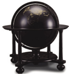
輪島漆芸美術館の見どころ・輪島塗大型地球儀

石川県輪島市で生産される伝統工芸「輪島塗」は、堅牢な塗りと加飾の優美さが特徴の漆芸で、国の重要文化財に指定されています。輪島特産の地の粉(珪藻土の一種)を下地に用い、塗り上げるまでに20工程以上、総手数では100以上に及ぶていねいな手作業で作られます。その発祥は諸説ありますが、室町時代には輪島に塗師がいたことが明らかになっています。また、技法が確立したのは沈金は18世紀、蒔絵は19世紀はじめとされています。今回はそんな輪島塗の作品が展示してある「石川県輪島漆芸美術館」にて、普段はなかなか会うことのできない漆芸の人間国宝の方から直々に輪島塗の歴史と作品について解説いただきます。