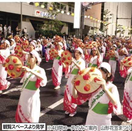
観覧スペースより見学 ※4日間一斉のみご案内 山形花笠まつり