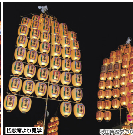
桟敷席より見学 秋田竿燈まつり