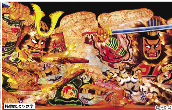
桟敷席より見学 ねぶた祭