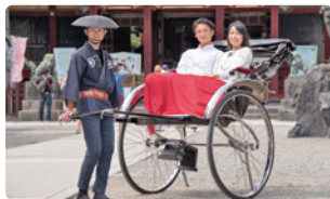
写真提供：浅草 時代屋 / イメージ

三社祭の宮神輿は、この浅草神社から宮出しされます。ここから人力車で待乳山聖天と今戸神社を巡ります。