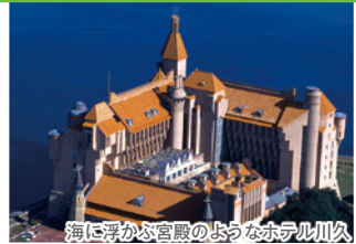
海に浮かぶ宮殿のようなホテル川久