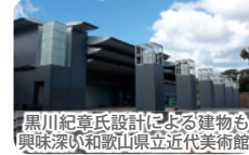
黒川紀章氏設計による建物も興味深い和歌山県立近代美術館

ツアー初日には【和歌山県立近代美術館】を訪ねます。故・黒川紀章氏設計による意匠を凝らした大型施設で、1998年に当時の建設省が選定・発表した「公共建築百選」にも選ばれています。所蔵作品点数は実に1万点を超え、地元作家および国内の作家の近代芸術作品が中心のコレクションですが海外作家の作品も多く、アンディ・ウォーホル、マーク・ロスコ、フランク・ステラ、ロイ・リキテンスタイン等まさに近代アートを代表する世界的な作家や、ムク、ピカソ、アンリ・マティス、カンディンスキー、ルオー、イサム・ノグチ等の近世~近代を代表する数々の作家の作品をコレクションしています。ツアーのもう1泊は和歌山県中部・田辺市の山中、「日本三大美人の湯」とも言われ約1300年の歴史を誇る龍神温泉の大自然の中にたえずも瀟洒な温泉旅館「季楽里龍神」にご宿泊いただきます。その他体験プログラムとして、田辺市の地域住民が出资方式で昭和28年築の小学校旧校舎を再利用し、平成20年11月にオープンして都市と農村の交流を目指した「グリーンツーリズム施設」で、農業体験学習等も行なっている「秋津野ガルテン」にて、梅染め等自然染めの染色体験と施設内の農家レストランでスローフード&地産地消の家庭料理中心の昼食をいただきます。そして最終日、最後に向かうのはパンダで有名な「アドベンチャーワールド」です! 現在日本で飼育されているジャイアントパンダは全部で13頭ですが、こちらではなんとその半数以上の7頭のパンダが暮らししています。 昨年11月22日に誕生し、ちょうど満1歳になるメスのパンダの赤ちゃん、楓浜は特に人気が高く、運が良ければ皆さまも会えるかも知れませんよ! ※撮影日:2021年10月2日