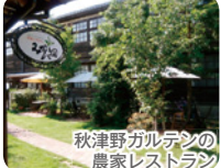
秋津野ガルテンの農家レストラン