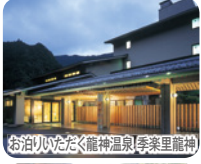
お泊りいただく龍神温泉(季楽里龍神)