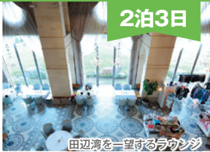
田辺湾を一望するラウンジ