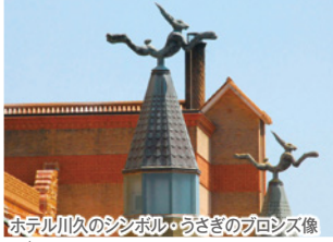
宮殿のような豪華なロビー ホテル川久のシンボル・うさぎのブロンズ像

ツアーは行きは羽田から関西空港へ入りバスで和歌山に向かい、帰りは南紀白浜空港から羽田に直行するので効率的に回れます。厳寒の2月ですが、本州では比較的暖かい和歌山でゆったり宮殿ホテルと温泉旅館に泊まり、アートに触れ、自然体験や熊野大社参拝、那智の滝見学、そしてパンダのファミリーたちと出会って癒されて、まだまだ続く寒い冬を乗り切りましょう!