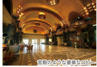
宮殿のような豪華なロビー ホテル川久のシンボル・うさぎのブロンズ像