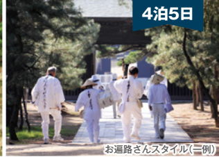
お遍路さんスタイル(一例)

2～3名様1室利用 (お一人様) 250,000円 羽田空港発着 ※羽田空港施設使用料580円(往復)を別途徴収させていただきます。