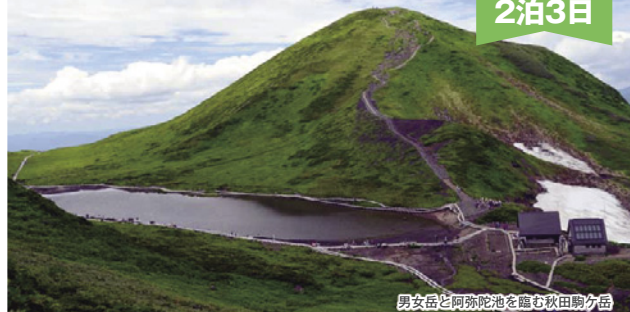
男女岳と阿弥陀山を臨む秋田駒ケ岳