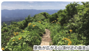
景色が広がる山頂付近の森吉山

阿仁ゴンドラ山麓駅(535m)→ゴンドラ山頂駅(1170m)→初級グループは森吉神社(1300m)、※中級グループは山頂(1454m)往復<初級グループは約2キロ、中級グループは約5キロを約3時間30分歩きます>。