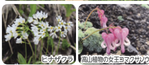
ヒナゲサクラ 高山植物の女王ヨマクサソウ