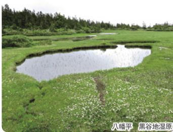
八幡平 黒谷地湿原

の原生林と湿原に囲まれた山です。火口湖である八幡沼あちこちに見られる湖沼と湿原の周辺を歩き可憐な高山植物を見ます。 八幡平頂上駐車場(1,580m)→八幡沼→源太森(1,595m)→黒谷地湿原(1,442m)→黒谷地湿原駐車場<約5キロ高低差200m>を昼食・休憩をはさみ約3時間歩きます>