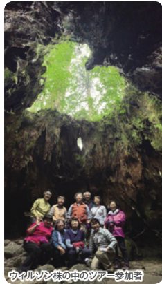
ウィルソン株の中のツアー参加者

縄文杉の旅は、通常日帰りで往復する22キロを、私達は2日に分けガイドの説明を聞きながらグループ毎に進みます。トロッコ軌道上とウィルソン株周辺では、屋久杉伐採の歴史と後の世代交代によって再生し続ける森を知ることができます。そして、何千年もの時を生き続ける巨木の森を抜け夕刻、縄文杉に到着します。夜はガイドが準備するテントで一泊します。また、ガイドが作る手料理もお楽しみください。到着から翌朝まで日帰りでは体験できない縄文杉との贅沢な時間を過ごします。