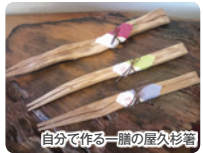
自分が作る一膳の屋久杉箸

最終日は「もののけの森」で一躍有名になった白谷雲水峡(入口からさつき吊り橋まで)を訪ねます。ガイドの案内で整備された遊歩道を歩きダイナミックな渓谷美、屋久杉、照葉樹を楽しみます。お昼は地元の食材をふんだんに使ったお料理をいただきます。最後に樹齢千年の屋久杉の端材を用いたお箸作り体験で、ご自分が作る一膳のお箸を完成させたら空港へ向かいます。