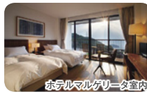
ホテルマルゲリータ室内