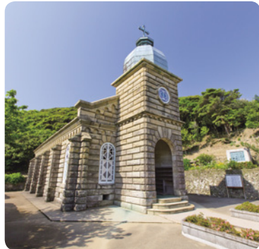
石造りの頭ヶ島天主堂

長崎県西部に浮かぶ約150の島々からなる五島列島はキリスト教伝来と繁栄、激しい弾圧と250年にも及び潜伏、そして復活は世界に類を見ない歴史を物語ります。祈りの島と呼ばれる五島には多種多様な美しい建築様式・ステンドグラスを持つ52程の教会堂が存在します。集落の中で祈りの場として生き続けている教会堂、そして生き続けることが出来なくなった集落・教会堂を渡し舟やジェットfoil、海上タクシーを使って島々を巡り、特徴ある主な教会堂、クリスチャン洞窟、そして島を囲んで広がる碧い海が織りなす自然の景観、五島列島を治めた福江藩に関わる歴史、無人島となった集落跡を垣間見られる場所を訪ねます。また、例年この時期にはいくつかの教会が信徒さんによってイルミネーションを施されます。今年につきましてはまだ決定していませんが行われる場合、希望される方には交通費別途にてご案内いたします。