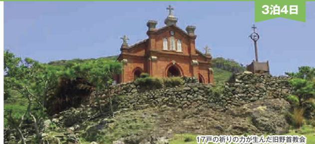
17戸の祈りの力が生んだ旧野首教会

野崎島 旧野首教会 信徒が食事を切りつめながら信仰の思いとして建てた教会。鉄川と助が初めて手がけた煉瓦造りの聖堂。世界遺産 ※野崎島は現在無人島です。旧野首教会を訪れるためにガイドの案内で集落跡を片道約30分、坂を歩きます。下記にも注意書きあり。