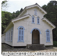
鉄川と助の代表作らしい木造教会江上天主堂

ご宿泊ホテル 宿泊は下五島では福江港に近くオープンしたばかりの「GOTO TSUBAKI HOTEL」。上五島では海を望む高台に佇み朝陽と夕陽を臨むことが出来る「五島列島リゾートホテル マルゲリータ」に連泊します。お風呂は湯量の豊富な自家源泉かけ流し。ゆっくりと旅の疲れを癒すことが出来ます。