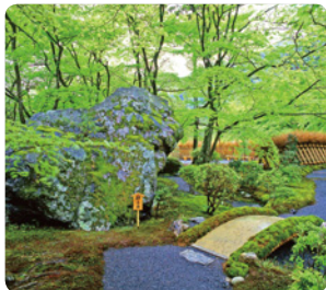
「獅子吼の庭」にある獅子岩

昨秋に初企画し、たいへん多数のお申込みをいただき高倍率の抽選となった京都の特別ツアーです。ご要望に応え、今年も紅葉シーズンに再取組します！ミシュラン認定のモダン町家風ラグジュアリーホテルに連泊し、世界遺産等の通常は入れない非公開エリアを貸切る特別な京都ツアーです！嵐山の臨濟宗大本山「世界遺産天龍寺」は特別拝観時以外は非公開ですが、今回はツアー初日、特別に住職自らの案内でお庭などを見学できることとなります。