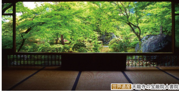
世界遺産 天龍寺の宝厳院大書院