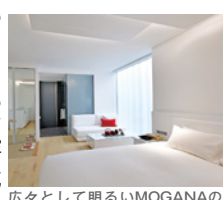
広々として明るいMOGANAのスタンダード客室