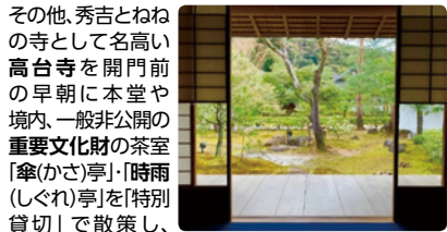
朝食をいただく高台寺の、ねね様のお茶室「湖月庵」

その他、秀吉とねねの寺として名高い高台寺を開門前の早朝に本堂や境内、一般非公開の重要文化財の茶室「傘(かさ)亭」「時雨(しぐれ)亭」を「特別貸切」で散策し、通常立入禁止の「臥龍廊(がりようろう)」も歩きます。朝食は高台寺のこれも通常非公開の「湖月庵」にて、お呈茶をいただきながら、有名な「瓢樹」(※瓢亭の系列店)の特製朝食弁当をいただきます。