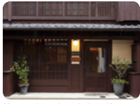
築100年の京町家を改装した「LUDENS」では、「身土不二」の薬膳イタリアンをいただきます