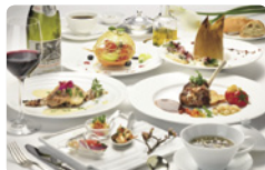
夕食フレンチ(イメージ)

松原湖畔に行み、磐梯山を望む標高約800mの高原リゾート、裏磐梯レイクリゾート迎賓館 猫魔離宮。国立公園内の大自然に囲まれた絶好のロケーションです。ホテル内に足を踏み入れた瞬間、日常から切り離された大人のラグジュアリーステイが始まります。館内には著名なアートや美術品の数々が展示され、ここでしか味わえない非日常を演出いたします。夕食は、旬を尽くしたフレンチ料理、地元産の新鮮な食材や高級食材を吟味する、旬の料理をご提供いたします。温泉は、「黄金の湯」として愛されてきた、天然成分豊富な「美肌の湯」を、心ゆくまでゆったりとご堪能ください。雄大な大自然、アート、温泉、美食の饗宴が、快適なご滞在をお約束いたします。