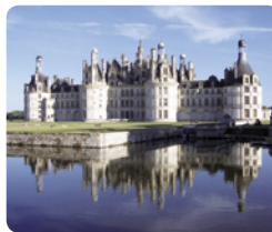
世界遺産 シャンボール城