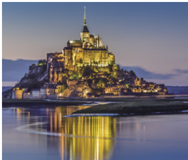
世界遺産 モンサンミッシェル修道院