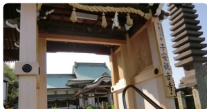
第80番 観音寺 御本尊は幼児を抱きかかえた聖観音菩薩で、「子授け安産」の信仰を集めています。本堂は、過去に三回の火災に見舞われ、焼失しましたが、お遍路さん、信者の方々の寄進により復興しました。

全行程、約150km。香川県の小豆島にあるこの霊場は、弘法大師(空海)が讃岐から京都へ上京または帰郷する際に、しばしば立ち寄り、島の各所で修業や祈念を行なったとされる霊驗あらたかな霊場です。弘法大師が修行の場としていたその歴史から、島の人たちは「元四国」と呼び、その文化やおもてなしの心を現在まで大切に継承してきました。霊場の特色は山岳の霊場があること。緑豊かな山道を鳥のさえずりを聞きながら歩いたり、海を眺めながら移動したり、豊かな自然と対話しながらの巡拝。それが小豆島巡拝の楽しみ方です。また国指定の重要文化財や天然記念物も数多く存在しているので見どころも満載です。