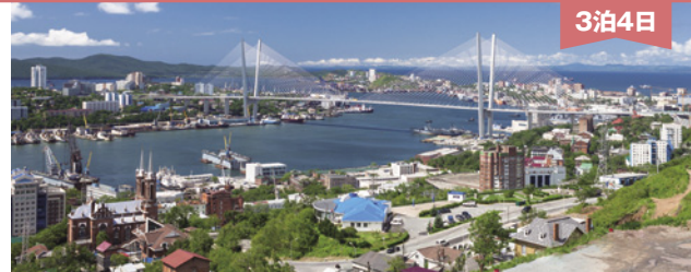
港と坂が美しい「極東のサンフランシスコ」と称されるウラジオストック

※時刻改訂、天候状況または現地事情等により日程の一部が変更される場合があります。 ※2日目のマリンスキー劇場での観劇は、劇場の公演予定により日程が変更になる場合があります。 ■添乗員・同行してお世話します（18日成田空港より4日成田空港まで）。現地では日本語ガイドがお世話します。 ■食事／朝食3回・昼食3回・夕食3回（機内食を除く） ■利用予定航空会社／ANA ■利用予定ホテル／ウラジオストック（3連泊）：ロッテホテル・ウラジオストック（5つ星）