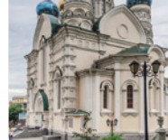
荘厳な雰囲気のあるロシア正教会