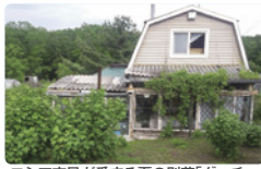
ロシア市民が愛する夏の別荘「ダーチャ」 通例、畑に囲まれた農地にあります

ご覧いただくほか、昼間シベリア鉄道にも体験乗車（40分程度）いたします。その他現地のご家庭を訪問して食事をいただいたり、スーパーマーケットでお買物をしたり、ロシア芸術（バレエ・オペラ）の聖地・殿堂として世界的にも有名にサンクトペテルブルグのマリンスキー劇場が2016年にオープンしたマリンスキー劇場の「沿海州劇場」にてご観劇もお楽しみいただく予定です。（※具体的な演目は1ヶ月程度前にならないと発表されません。）更に日本語や日本文化を学んでいる現地の生徒さんらとの交流会も予定しています。成田から添乗員も同行しますので、お一人様でも安心してご参加いただけます。