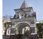
ニコライ皇太子凱旋門