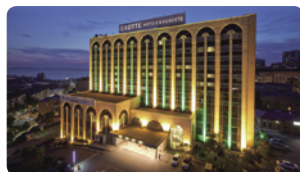
宿泊予定のウラジオストック中心部では唯一の高級5つ星ホテル「ロッテホテル」

1920年代には6000人もの日本人が住んでいました。その他多数のウクライナ人、朝鮮人、中国人、タタール人、ペラルーシ人も住んでいました。戦後は軍港のためソビエト連邦により「閉鎖都市」とされ長らく外国人立入禁止でしたが、ソ連崩壊後の1992年、ようやく外国人に再開放されました。帝政ロシア時代からの歴史あるヨーロッパ風の建物が港をバックに坂道の多い街に立ち並びオシャレな風景は日本人にもとても人気があります。お泊りはウラジオストック中心部では唯一とも言える高級近代ホテル・ロッテホテルに3連泊します。またお食事はロシア極東地方で獲れた新鮮な海鮮類もご用意しています。さらにツアーではウラジオストック市内をゆっくり