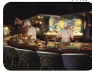
鉄板料理(イメージ)