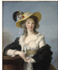
エリザベト・ルイズ・ウイジェ・ルブラン

日本・東洋・西洋の各国、各時代の絵画・彫刻・陶磁・漆工・武具など様々なジャンルの作品約3万点を収蔵する東京富士美術館。特に西洋絵画500年の流れを一望できる油彩画コレクションと現代までの写真史を概観できるコレクションが最大の特徴です。