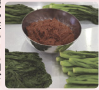
麗水の名物・カラシナのキムチ作りも体験!

★キムジャンとは、寒い冬に備えて隣近所の主婦たちが互いに手伝いながら大量のキムチを漬け込む季節・行事のこと。