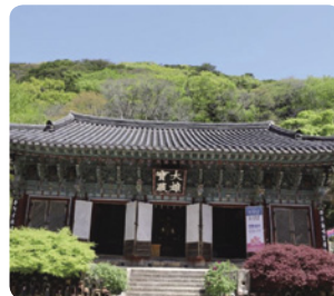
世界遺産 古刹・大興寺