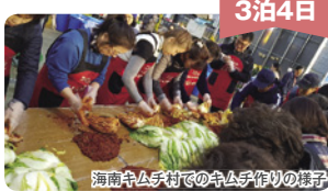
海南キムチ村でのキムチ作りの様子