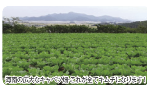
海南の広大なキャベツ畑。これが全てキムチになります!