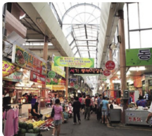
木浦・東部在来市場の様子