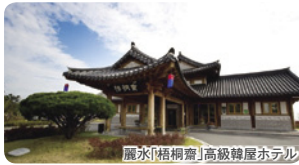
麗水「梧桐堂」高級韓屋ホテル