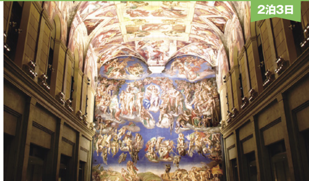
大塚国際美術館・システィーナ礼拝堂(写真は美術館の展示作品を撮影したものです)