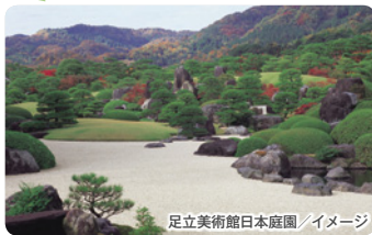
足立美術館日本庭園/イメージ

魅力にも触れていただけます。秋にしか見る事の出来ない横山大観の名作「紅葉」は、朱を用いて表現した紅葉の濃淡や当時としては型破りだった余白のない大胆な構図など最も絢爛豪華な趣を持ち、毎年この作品を観るために来館される方も数多いそうです。