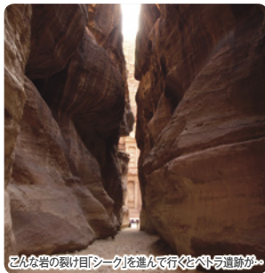
とんちん岩の裂け目「シーク」を遡って行くペトラ遺跡への入り口