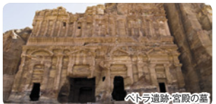
ペトラ遺跡:宮殿の墓