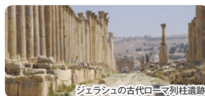
ジェラシュの古代ローマ列柱遺跡

ツアー全体の期間はなるべく短くして参加しやすくしましたが、ペトラ以外にも周辺の史跡や名所、 モーセの墓所 があるとされる「ネボ山」、ローマ都市の遺跡が多く残る「ジェラシュ」、そしてペトラ周辺の砂漠の中にあるやはり【世界遺産】の奇観「ワディ・ラム」も訪れ、 砂漠の中の豪華テント に泊って星空の下の砂漠の夜を体験します。さらにあの「死海」では、有名な「浮遊体験」もお楽しみください! また国立博物館など 首都アンマン の観光も入れています。もちろん地元の文化の体験や地元の方との交流も予定しています。食事はやはり地元の名物料理を多く取り入れて、飽きが来ないようバラエティ豊かにしました。ホテルも各地の定評ある良いロケーションの人気ホテルを厳選しています。日本から添乗員も同行しますので、お一人様でも安心してご参加いただけます。