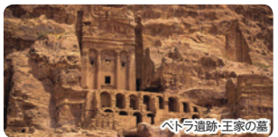
ペトラ遺跡:王家の墓