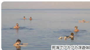
死海でプカプカ浮遊体験!

遺跡に続く巨大な岩の裂け目「シーク」の長い道を、宝物探しの冒険に出かけるようにワクワクしながら進み、ようやく抜けると少しずつ岩の影から見えてくるペトラの象徴「エル・ハズネ」の圧倒的な姿には、何物にも変えがたい感動を覚えることでしょう。また朝日や夕陽に映えて赤く染まる姿も幻想的です。