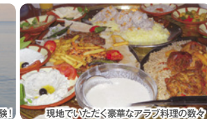
現地でもいただく豪華なアラブ料理の数々