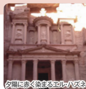
夕陽に赤く染まるエル・ハズネ