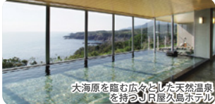
大海原を臨む広々とした天然温泉を持つJR屋久島ホテル

縄文杉の旅は、通常日帰りで行く22キロを、私達は2日に分けガイドの説明を聞きながらグループ毎に進みます。トロッコ軌道上とウィルソン株周辺では、屋久杉伐採の歴史と後の世代交代によって再生し続ける森を知ることができます。そして、何千年もの時を生き続ける巨木の森を抜け夕刻、縄文杉に到着します。夜はガイドが準備するテントで一泊します。また、ガイドが作る手料理もお楽しみください。到着から翌朝まで日帰りでは体験できない縄文杉との贅沢な時間を過ごします。翌朝縄文杉を出発し同じ道を戻り、夕刻、贅沢なまでのとろみ感の天然温泉が、大海原を一望できる大浴場と露天風呂にたたえられた、JRホテル屋久島に入ります。温泉と美味しい夕食でトレッキングの疲れを癒してください。