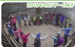
2019年4月ツアーの様子 皆で手を上げた幅が縄文杉の幹と同じ太さ

最終日は「ものけの森」で一躍有名になった白谷雲水峡(入口からさつき吊り橋まで)を訪ねます。ガイドの案内で整備された遊歩道を歩きダイナミックな渓谷美、屋久杉、照葉樹を楽しみます。お昼は地元の食材をふんだんに使ったお料理をいただきます。最後に樹齢千年の屋久杉の端材を用いたお箸作り体験で、ご自分で作る一膳のお箸を完成させたら空港へ向かいます。