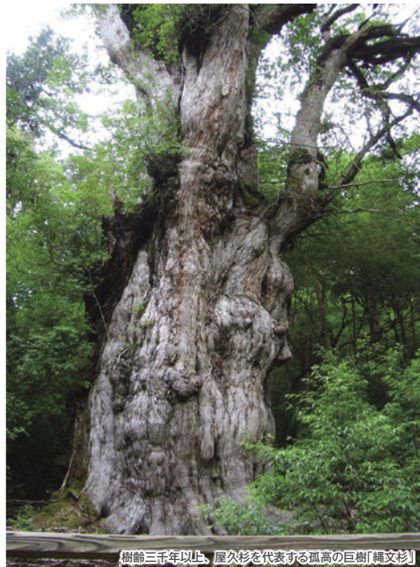
樹齢三千年以上、屋久杉を代表する風高の巨樹「縄文杉」

5月18日の豪雨災害では屋久島は大きな被害に見舞われました。しかしながら現在登山道のトイレはすべて復旧し、電気も通り、登山道も仮復旧、6月中の完全復旧を目指して屋久島全体が動いております。災害の時にも一人の怪我人も出さずに300人が下山できたというガイドの素晴らしい力と、このツアーの行程には影響がないという屋久島の言葉を受けて今回は秋のツアーを実施いたします。