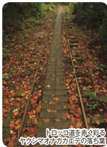
トロッコ道を歩く形 ヤクシマカガキユヅの落ち葉