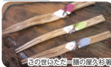
この世にただ一膳の屋久杉酒

最終日は「ものけの森」で一躍有名になった白谷雲水峡(入口からさつき吊り橋まで)を訪ねます。ガイドの案内で整備された遊歩道を歩きダイナミックな渓谷美、屋久杉、照葉樹を楽しみます。お昼は地元の食材をふんだんに使ったお料理をいただきます。最後に樹齢千年の屋久杉の端材を用いたお箸作り体験で、ご自分で作る一膳のお箸を完成させたら空港へ向かいます。