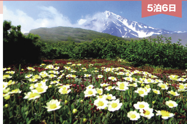
チョウノスケツウが咲き誇るアヴァチャ山

北方領土の北東に連なる千島列島の最北端がぶつかる広大なカムチャツカ半島。長さ1,250km、面積472,300km 2 と日本より25%も大きいですが、極北の地にあり1年の大半は雪と氷に閉ざされ、特に北部では冬期、極夜で1日中太陽が昇ることはありません。総人口は36万人弱で最大都市の州都ペトロパブロフスク・カムチャツキーに約半数の18万人が住んでいます。