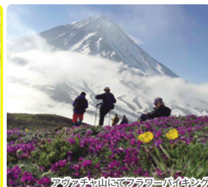
アヴァチャ山にてフラワーハイキング

そんなカムチャツカですが、とても短い夏の間、広大な大自然の原野が夏を謳歌する高山植物等の色とりどりの花々で一面覆われ夢のような光景を満喫できることで有名です。本ツアーではそんな素敵な自然からの贈り物のような景色を求めてカムチャツカの大自然の原野でのハイキングを楽しみます!