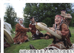
伝統の歌舞を楽しむ先住民の若者たち