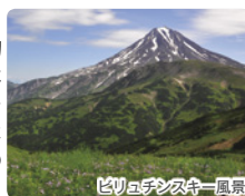
ピロエンススキー風景

そんなカムチャツカですが、とても短い夏の間、広大な大自然の原野が夏を謳歌する高山植物等の色とりどりの花々で一面覆われ夢のような光景を満喫できることで有名です。本ツアーではそんな素敵な自然からの贈り物のような景色を求めてカムチャツカの大自然の原野でのハイキングを楽しみます!