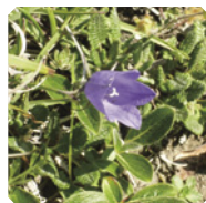
イワギキョウ/イメージ