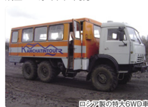
ロシア製の特大6WD車

以前は日本からも直行の夏季限定チャーター便があったのですが、廃止された今年は極東ウラジオストク経由で州都ペトロパブロフスク・カムチャツキーに飛びます。現地では州都近郊のバラトゥンカ温泉郷のホテルに3連泊し、現地の自然ガイドの案内でいろいろな高山植物等のお花を求めて毎日違った場所をハイキングします。また州都では博物館や記念碑、展望台等の市内観光、そしてカムチャツカを象徴する山とも言われる標高2,741mの活火山アヴァチャ山の麓ではロシア製の特大6WD車にてベースキャンプまでご案内しフラワーウォッチングを楽しみます。成田から添乗員も同行しますので、お一人様でも安心してご参加いただけます。