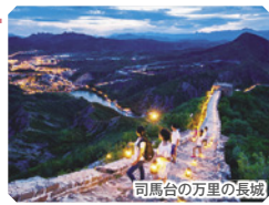
司馬台の万里の長城

～古鎮を見下ろす◎司馬台長城をロープウェイにてご案内、その後美しい夜景観賞のスポットにご案内しながらホテルへ～ ※注意：3日目午前中にも観光します。